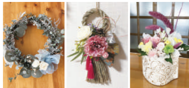
①11月 ②12月 ③1月

クラッシモではセミナールームの貸出しを行っております。(お問合せはショールーム受付まで)