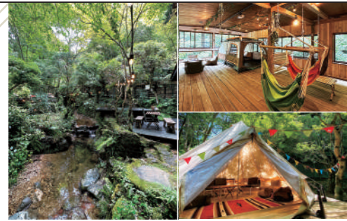
緑豊かな敷地内には川が流れ、紅葉シーズンはテラス席(ベット同伴可)がおすすめ 大阪最大級のハンモックカフェ(右上・2F)・移動型グランピング(右下・企画中)