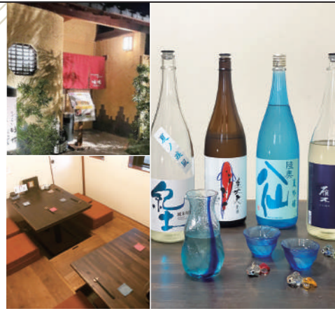
10名様まで利用できる個室は特に女性に人気。通年楽しめる季節酒。この夏は美味しい冷酒をぜひ。

4年前にオープンした、おばんざいとお酒が美味しい和食居酒屋。お料理好きの美人おかみがつくるおばんざいは魚・肉・野菜とバランスのいい献立で、やさしさがあふれている。おかみのお母さんときりもりしながら、女性スタッフのきめ細やかな接客にも居心地◎。男性客はもちろん女性客やファミリーのファンも多い。メニューのアラカルトは50種以上もあり、お値段もリーズナブル。お酒も日本酒・地酒・季節酒・焼酎など多種取り揃えている。