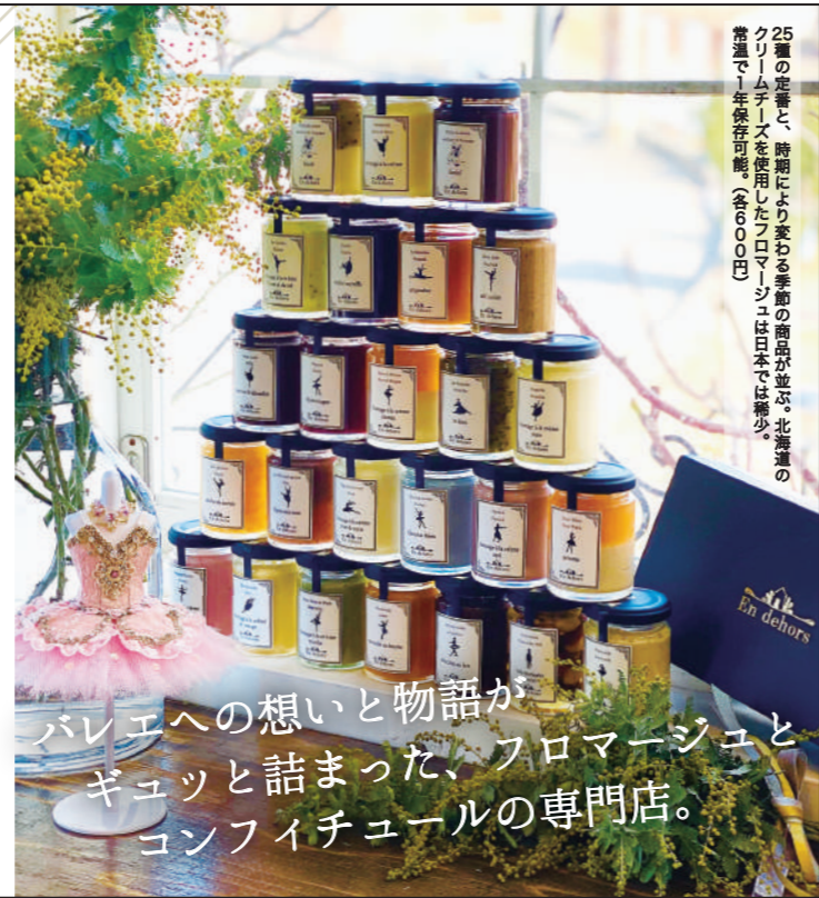
25歳の娘は、東京山手区にある有名私立女子校でバレー部で活躍中。バレーの物語とキャラクターがデザインされた瓶には、バレーの物語とキャラクターがデザインされていてその世界観が伝わってくる。

のどかな風景の中にフランスを思わせるお庭と店舗。ここは独自の手法で製造したクリームチーズのスプレッド(フロマージュ)とフルーツのジャム(コンフィチュール)の専門店。「娘のバレーに魅了されて...」と語るシェフの想いと美味しさがギュッと詰まった瓶には、バレーの物語とキャラクターがデザインされていてその世界観が伝わってくる。パンやクラッカー、ヨーグルトなどにより合い、楽しみ方は何倍にも広がる。発表会の楽屋見舞いや贈答品、日々の食卓にも是非。