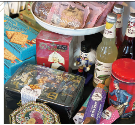
店内にはフロマージュやコンフィチュールの他、奥様が厳選したグロッサリーや菓子類がずらりと並び、こちらも人気。素敵なセレクトにワクワクする。

のどかな風景の中にフランスを思わせるお庭と店舗。ここは独自の手法で製造したクリームチーズのスプレッド(フロマージュ)とフルーツのジャム(コンフィチュール)の専門店。「娘のバレーに魅了されて...」と語るシェフの想いと美味しさがギュッと詰まった瓶には、バレーの物語とキャラクターがデザインされていてその世界観が伝わってくる。パンやクラッカー、ヨーグルトなどにより合い、楽しみ方は何倍にも広がる。発表会の楽屋見舞いや贈答品、日々の食卓にも是非。