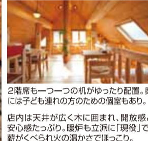
2階席も一つ一つの机がゆったり配置。奥には子ども連れの方のための個室もあり。店内は天井が広く木に囲まれ、開放感と安心感たっぷり。暖炉も立派に「現役」で、薪がぐらぐら火の音がほっこり。

が上がるほど感動します。温かみのある木の素材を基調としたインテリア、コーヒーの香りを放つサイフォン。素朴ながらも美しい机や椅子も手づくりというから驚きです。店内の窓は大きく、千早赤阪村の美しい自然が一枚の絵のように眺められ、それだけでも時間の流れを忘れてしまうほどです。「ここまで来て頂くのですから、心からのおもてなしとお料理をお出ししたいんです。自家農園で採れた野菜をたっぷり使ったメニューや、国産牛肉の煮込みハンバーグをご用意していますので、時間を忘れてゆっくりくつろいでいただければ嬉しいですね。」 その煮込みハンバーグは、口の中で濃厚なソースと絡み合い、とろけるほどジューシー。採れたて野菜をふんだんに使った天ぷらや副菜も、口に入れた途端「野菜ってこんなに味があった?」とスタッフが驚くほど「迫力」があり、箸が止まりません。 まさに窓の外の景色とともに「季節を食べる」喜びに浸れるひと時。子ども連れのママさんたちにもゆっくり過ごしてほしい……と、ベビーベッドと絵本が用意された個室があるのも、とても嬉しい心づかいです。 ゴルフレッスンの合間に立ち寄り方、ウォーキングのコースの休憩として組み込んでいる奥様方、さらにはサイクリングの途中で必ず顔を見せる常連など、ここで一息つくことを楽しんで