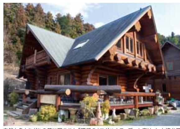
自然と色とりどりの花に囲まれた「理想の」ログハウス。デッキ席はペット連れ可なのも嬉しい。

天ぷらの和風プレート(ドリンク、サラダ、みそ汁付き 1360円)、季節の採れたて野菜が存分に楽しめる。 煮込みハンバーグ(ドリンク、サラダ、スープ付き1360円)、トロロロージュシー!上から時計回りにスープ、サラダ、白菜たっぷりの湯豆腐、田辺大根の佃煮、エビフライ、煮込みハンバーグ、ご飯。副菜は季節ラダ付き 840円はクセになる深み。によって変わります。