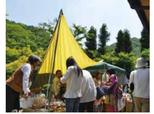
昨年5月にスタートして今回は3回目。

企画&主催は、市内で自然派育児をテーマとした活動を続ける「ルフトクライン」と「河内長野での暮らしをもっと楽しく」をコンセプトに、デザイン企画制作やイベントを行う「アトリエアノール」。いずれもメンバーは、子育て中のママたちです。「自分たちが暮らす奥河内で、シンプルなお・モノを提供する人と、シンプルな生活を考える人をつないで地域を元気にしたい」との想いからスタートしました。 会場となる南天苑は美しい日本庭園や温泉をもつ老舗旅館。当日は奥河内地域の有機・無農薬(減農薬)の野菜やお米をはじめ、体に安心な食材を使ったパンやスイーツ、絵本読み聞かせ、ヨガ・マッサージ、自然派ネイル、子ども向けワークショップなど約35の個性豊かなショップコーナーが出店します。入苑無料。開催は9～15時。雨天決行。なお、お出掛けの際はマイバック・マイ箸をお忘れなく! イベント主旨により駐車場はありません。