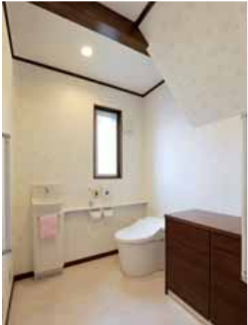
まるで個室のようなトイレは将来、介護が必要になっても介助のスペースがとれるので、母はデスク際の段ボールの間に椅子を置いてあるので休憩も、お母様が選ばれたピンク系の花柄のクロスは、洗面所で楽々お掃除です。

●発行所 河内長野ガスグループ 株式会社リビングセンター長野 〒586-0025 河内長野市昭和町14-32 TEL.0721-52-5270 (代) ●発行人 山本朝雄 ●編集協力 河内ビジネスインフォメーション株式会社